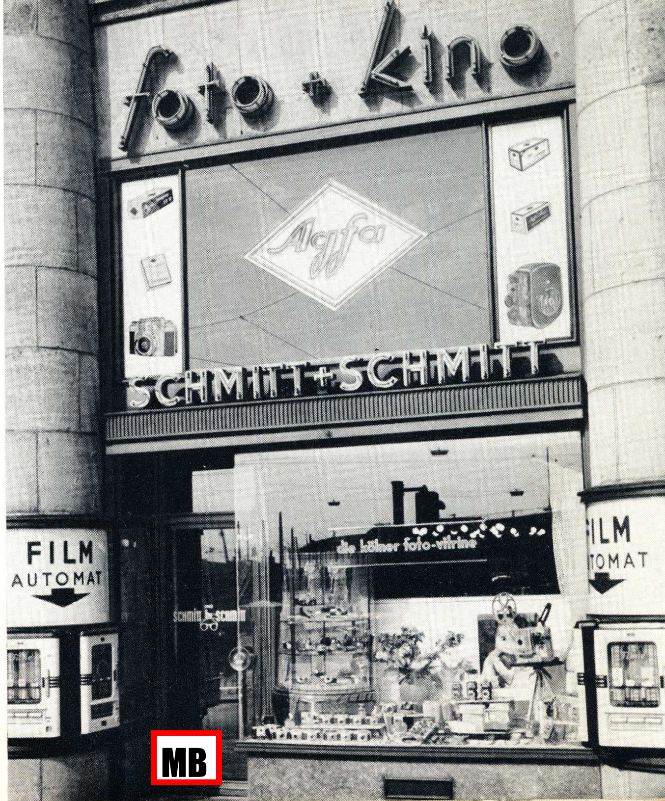
Wie immer: Achten Sie auf den Doppelnamen Schmitt & Schmitt